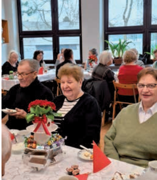
Relacja z Dnia Chorego w naszej parafii s. 7-10